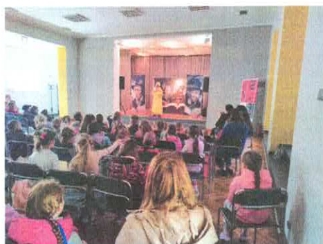
Teatr z uśmiechem z Krakowa - Księga Andersena - przedstawienie dla dzieci z okazji 220 rocznicy urodzin i 150 rocznicy śmierci baśniopisarza.