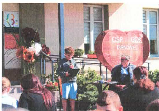
Narodowe Czytanie – Ku wiecznej pamięci mistrza z Czarnolasu