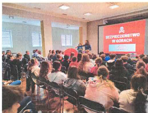
Warsztaty survivalowe z podróżnikami dla młodzieży